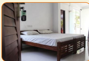
logement en clinique. Clinique

L'hébergement est en chambres doubles. Même de bonne catégorie, le standard des hôtels indiens ne correspond pas toujours au standard des hôtels occidentaux. De petites imperfections subsistent. Attention certains hôtels ne proposent que des lits King size Nos hôtels sont de petits hôtels de charme, ils n'ont pas beaucoup de chambres.