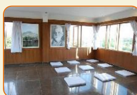
Hotel Ramana Tower. Tiruvanamalai