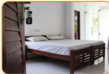
logement en clinique. Clinique

L'hébergement est en chambres doubles. Même de bonne catégorie, le standard des hôtels indiens ne correspond pas toujours au standard des hôtels occidentaux. De petites imperfections subsistent. Attention certains hôtels ne proposent que des lits King size Nos hôtels sont de petit hôtel de charme, ils n'ont pas beaucoup de chambre.