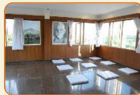
Hotel Ramana Tower. Tiruvanamalai